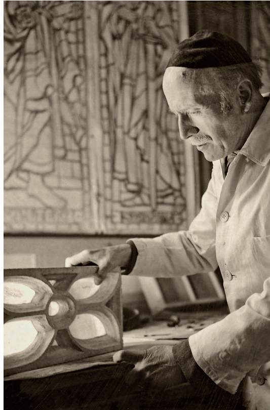
◀ Richard Arthur Nüscheler (1877–1950) in seinem Atelier, der alten Kirche Boswil: Die Kirche als Raum und Objekt stand zeitlebens im Zentrum seines künstlerischen Schaffens.