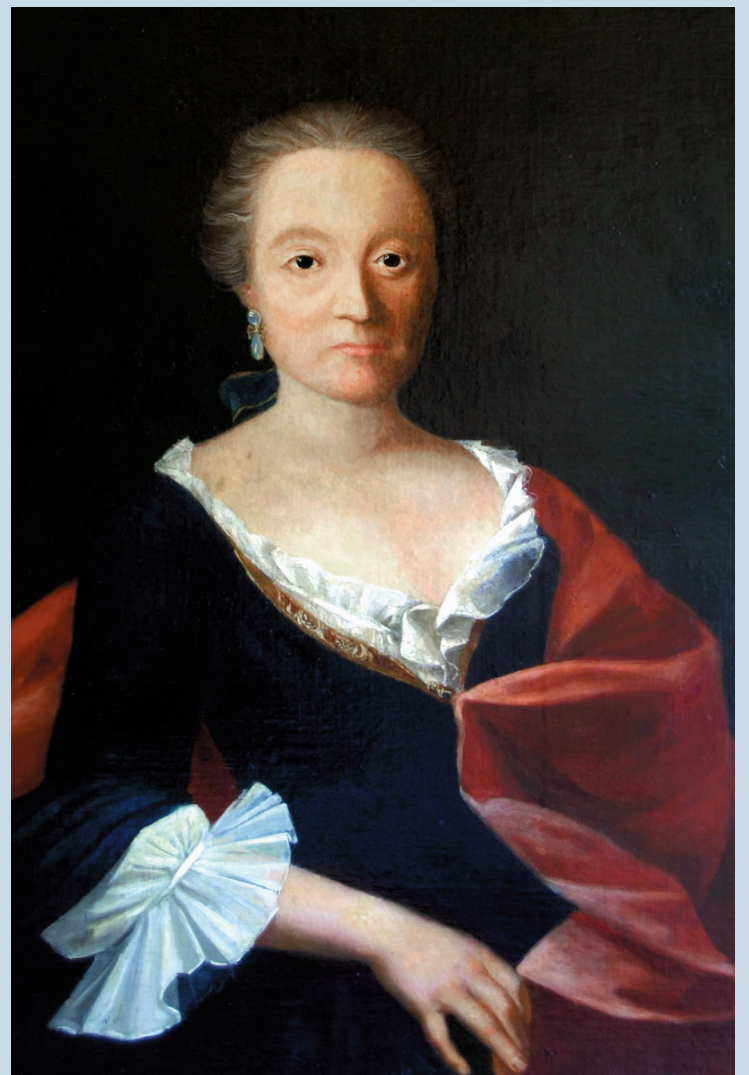
^ Matthias Nüscherler (1716–1777) und seine Gattin Anna Dorothea Nüscherler-Ziegler (1716–1781) waren in der 2. Hälfte des 18. Jahrhunderts Eigentümer des «Grünenhof». Die mit Jagdszenen bemalten Leinwandtapeten, mit denen zu dieser Zeit die repräsentativen Räume der Liegenschaft ausgestattet wurden, befinden sich heute im Schweizerischen Landesmuseum.