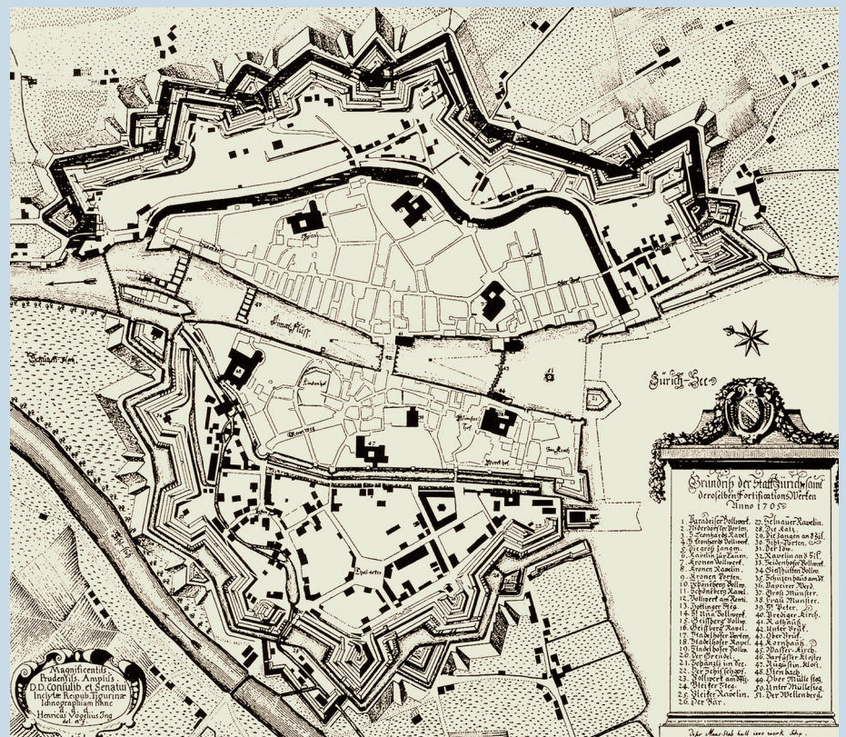
▲ Bauliches Entwicklungsgebiet zwischen mittelalterlicher Stadtmauer und neuen Bastionen: Die Karte von 1705 zeigt den «Magazin Hof» als alleinstehendes Haus an der heutigen Talackerstrasse. Der Rest des Nüscherer'schen Grundstücks am heutigen Pelikanplatz ist noch nicht überbaut.

Mit dem «Magazin Hof» sollte nicht ausschliesslich ein Wohnhaus erstellt, sondern gleichzeitig auch Arbeitsraum (für «Handthierung und Gewerbe») geschaffen werden. 180 Die Baupläne für den «Magazin Hof» wurden