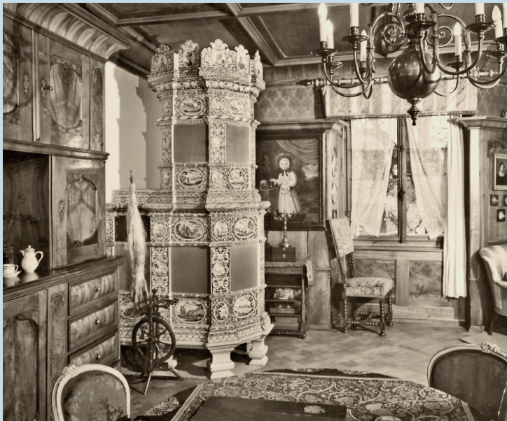
▲ Drei Ansichten der Liegenschaft «Neuegg» vor dem Abriss im Jahre 1948: Blick von der heutigen Nüscherler-Strasse (rechts die Liegenschaft «Kaufleuten») auf den Pelikanplatz (oben), Blick vom Pelikanplatz in Richtung Nüscherler-Strasse (Mitte), Innenansicht (unten).