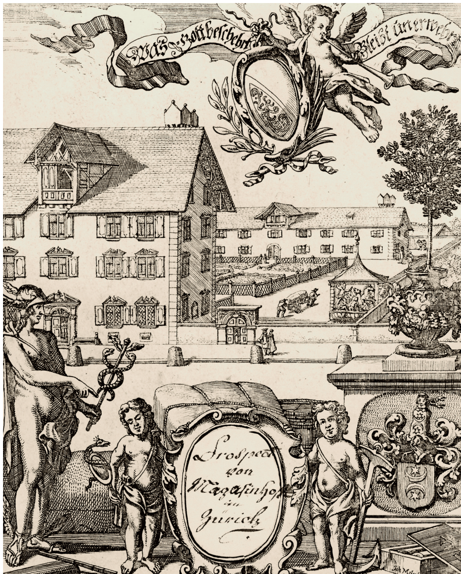
◀ Wohn- und Produktionsstätte auf demselben Grundstück: Der 1698 erbaute «Magazin Hof» mit Wohnung, Gartenanlage und Ökonomiegebäude («Fabrica») zur Zeit von Kaufmann und Statthalter Felix Nüscherler (1692–1769).