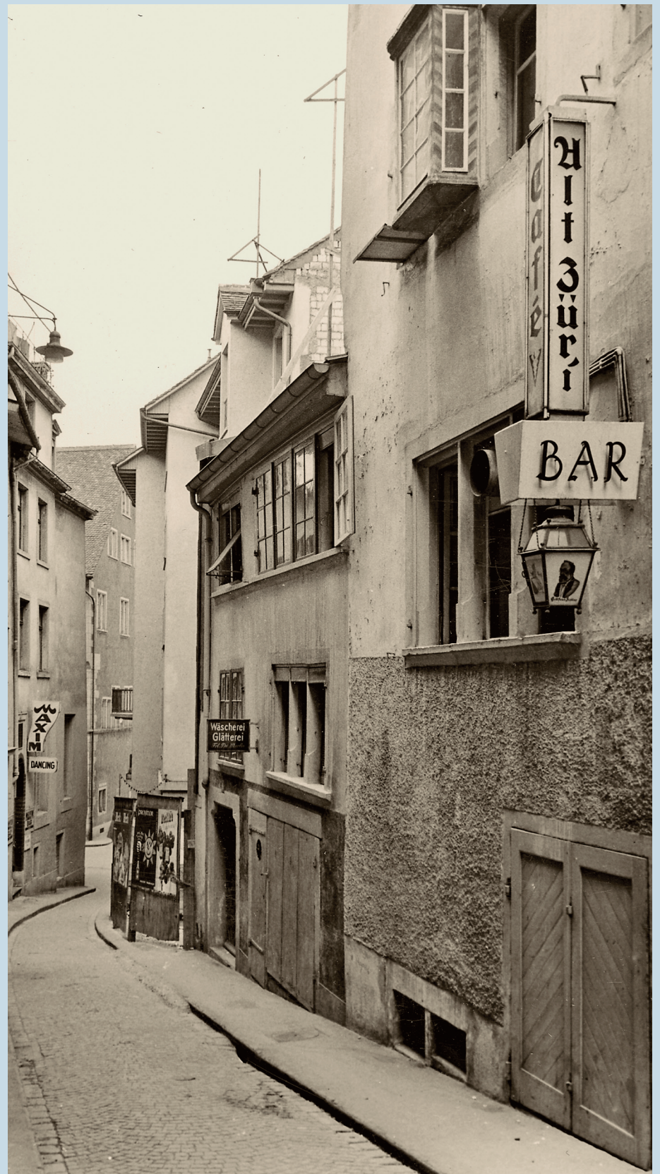
▲ Mittelalterliche Enge: Die Schoffelgasse (das Haus «Zur Henne» befindet sich unterhalb der «Alt Züri Bar»), verbindet die Münstergasse mit dem Limmatquai. Die Bewohner der Gasse stammten bis ins 19. Jahrhundert vorwiegend aus dem handwerklichen Milieu.