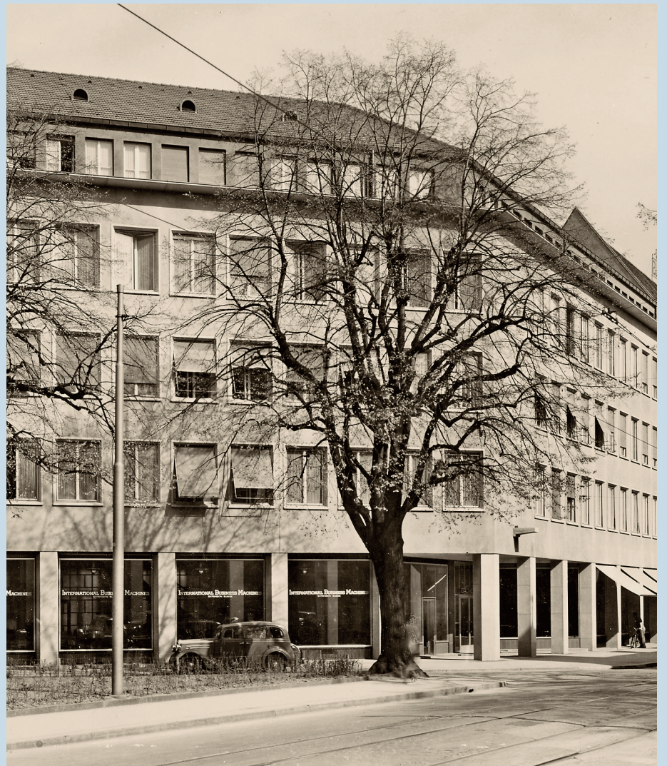
^ Die Gebäude haben noch heute die alten Namen «Neuegg» (links) und «Grünerhof» (rechts), der Charakter des Quartiers am Talacker hat sich aber seit Mitte der 1950er-Jahre grundlegend verändert: Die barocke Vorstadt hat einem Geschäftsviertel weichen müssen.