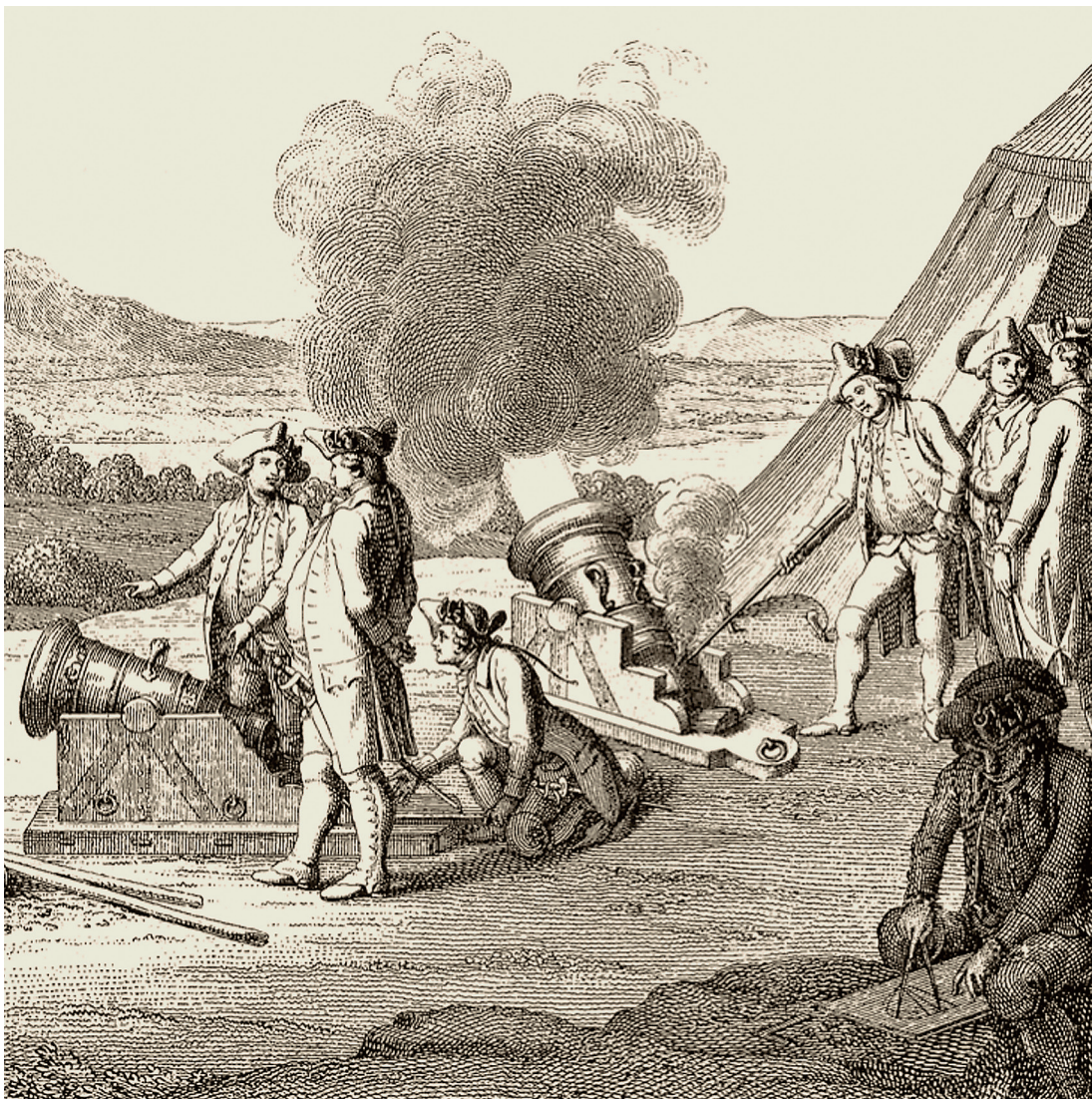
^ Das Artilleriekollegium (Feuerwerkergesellschaft) widmete sich der Ausbildung der Zürcher Artilleristen. Neben dem sogenannten Ernstfeuerwerk, dem eigentlichen Artilleriehandwerk, wurden die Kollegianten auch im Herstellen von Lustfeuerwerken ausgebildet, worunter man Feuerwerke im heutigen Sinn verstand.

In der Not wechselte er das Gewerbe und eröffnete einen bis anhin in Zürich unbekanntem Handlungszweig: Produktion und Vertrieb von Feuerwerkskörpern. Als Artillerist hatte er sich im Rahmen seiner Ausbildung innerhalb der Feuerwerkergesellschaft hierbei