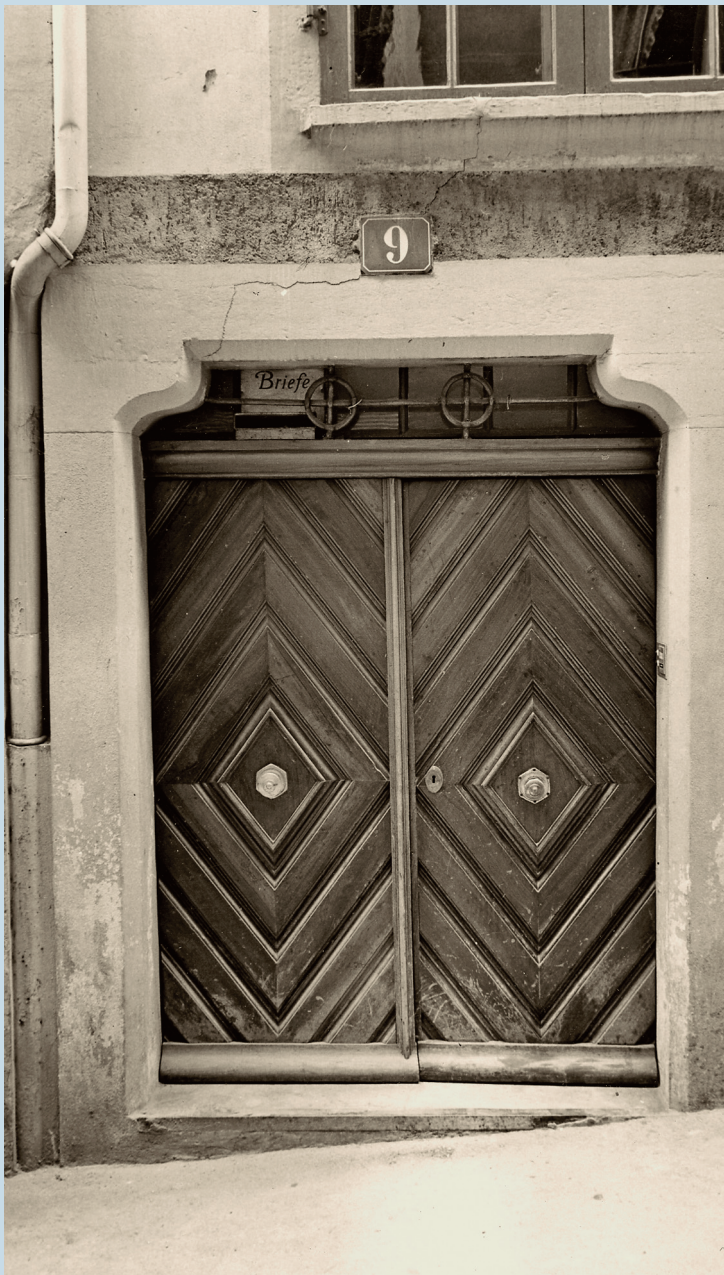
▲ Schoffelgasse 9: Eingang zum Haus «Zur Henne», dem «Nüscheler-Haus». Die Liegenschaft wurde in den 1950er-Jahren abgetragen und anschliessend wieder neu aufgebaut.

In den 50er-Jahren des 20. Jahrhunderts ist das Gros der nördlichen Häuserzeile (Schoffelgasse 1–9) abgetragen und unter geringfügiger Zurücknahme der Strassenflucht neu errichtet worden.