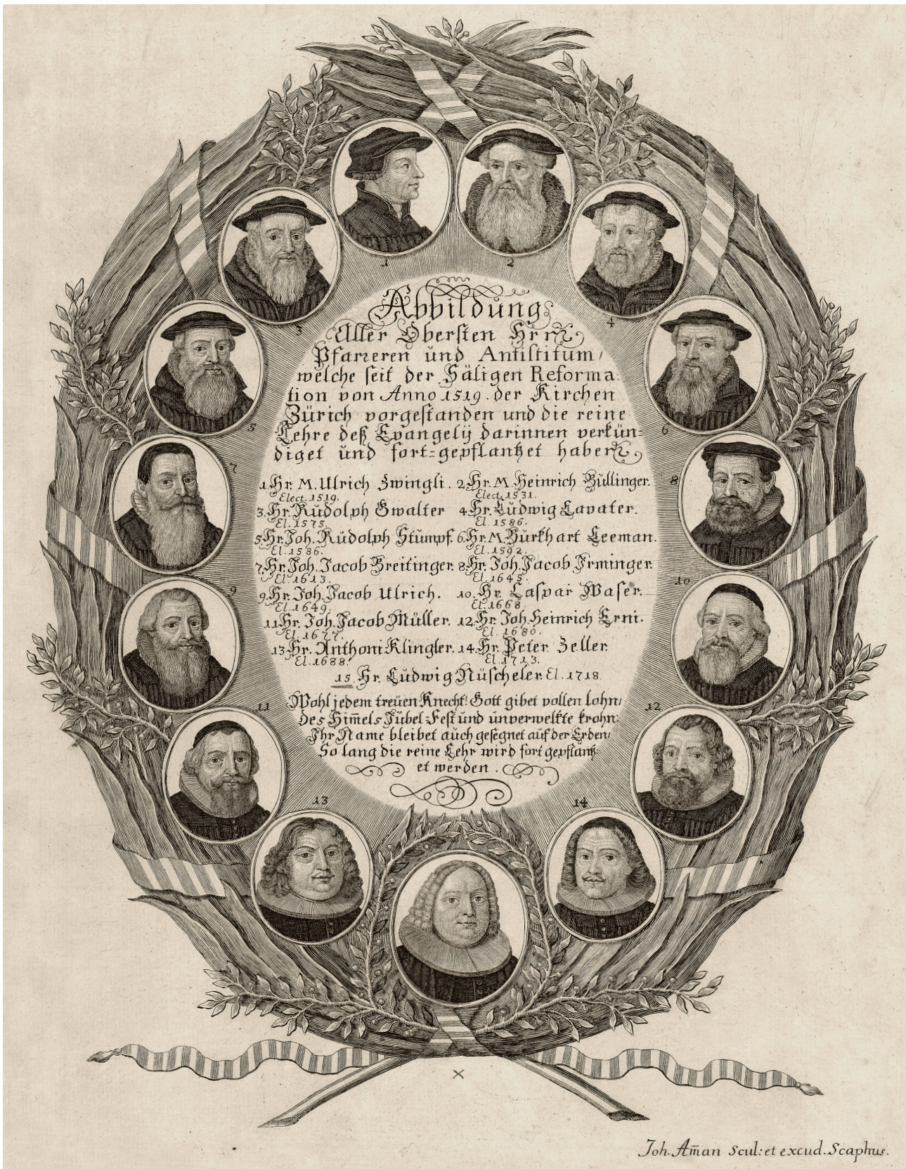
^ In der Nachfolge von Ulrich Zwingli (1484–1531) und Heinrich Bullinger (1504–1574): Antistes Ludwig Nüscherler (1672–1737) (Porträt unten) war der 15. Vorsteher der Zürcher Kirche.