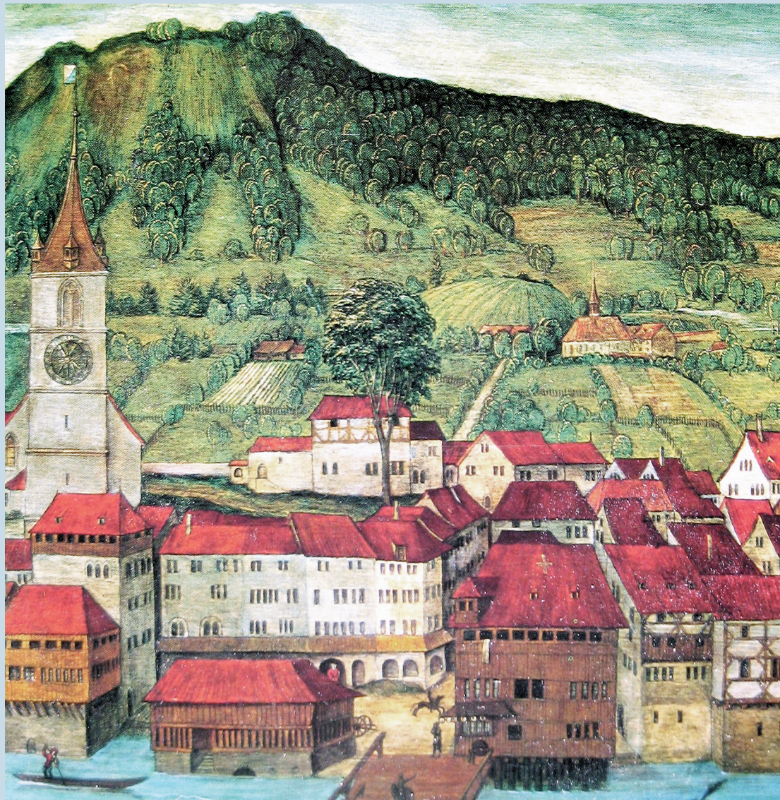
› Ausschnitt der Leu'schen Altartafeln 1: Blick auf St. Peter, Weinplatz und Haus «Zum Schwert». Im Hintergrund sind das Zisterzienserinnenkloster Selnau und der Üetliberg zu erkennen.

Nach Felix Nüscher's Hinschied übergaben seine Nachfahren 1817 das Altarbild den Stadtbehörden, welche es anschliessend der Sammlung der Antiquarischen Gesellschaft übergaben. Heute gehört das Bild zum Fundus des Schweizerischen Landesmuseums.