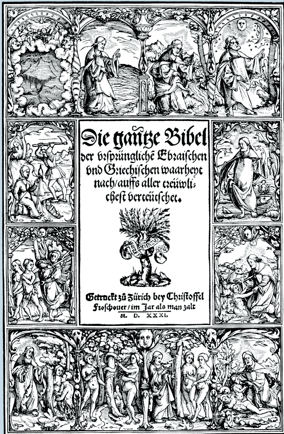
^ Die Zürcher Bibel, 1531 bei Christoph Froschauer gedruckt, als Exportgut: Zürcher Pfarrer wirkten nicht nur auf Zürcher Boden, sondern auch in den benachbarten Kantonen oder gar im Ausland: z. B. im aargauischen Seengen oder in Bad Grönenbach im bayrischen Allgäu.