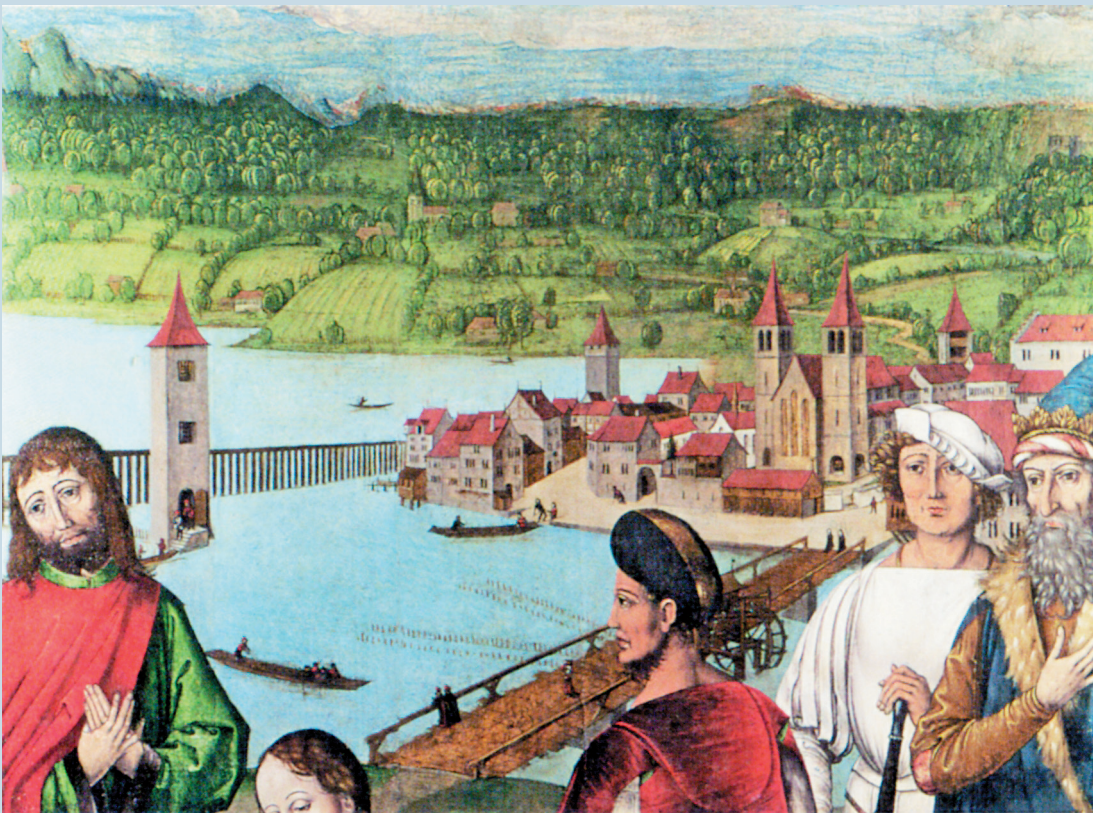
◀ Ausschnitt der Leu'schen Altartafeln 3: Martyrium der Zürcher Stadtheiligen Felix und Regula sowie ihres Dieners Exuperantius (Vordergrund). Im Hintergrund sind die Fraumünsterabtei, der Wellenberg und die Münsterbrücke zu erkennen.