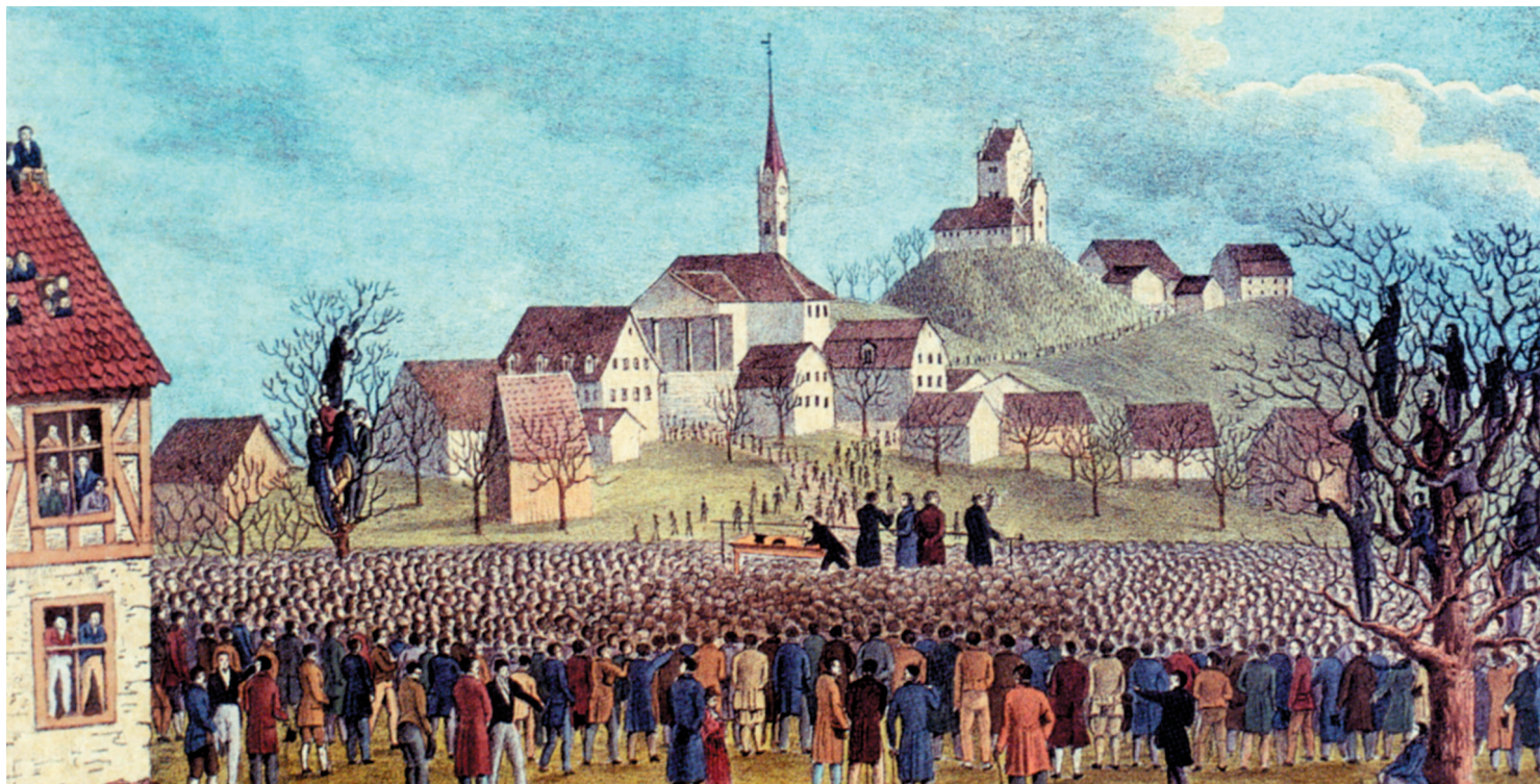
▲ Rund 10000 Männer der zürcherischen Landschaft versammelten sich am 20. November 1830 in Uster. Ihre Forderung war eine neue Verfassung, welche die Gleichstellung von Stadt und Land gewährte.

Die Juli-Revolution in Frankreich im Jahr 1830 – die Nüscheler nicht oder zumindest nicht zu diesem frühen Zeitpunkt erwartet hatte – bildete die Zäsur in seinem publizistischen Leben. Sein Selbstverständnis