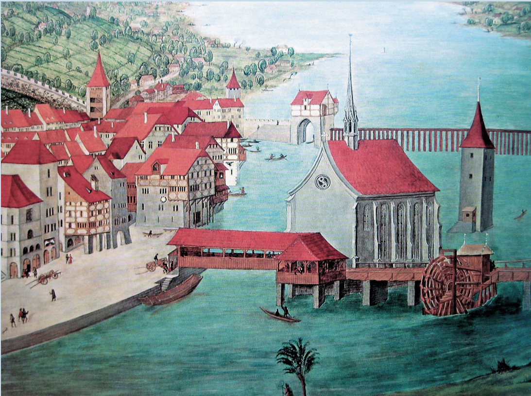
◀ Ausschnitt der Leu'schen Altartafeln 2: Blick auf die Wasserkirche, Wellenbergturm und Grendeltor, im Hintergrund das Zürichhorn und das noch nicht überbaute Riesbach.